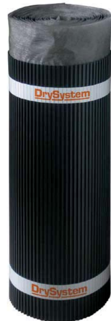
Pratico rotolo di altezza 80 cm per 15 metri di lunghezza.

Nel ripristino di vecchie murature dove l'umidità ha sgretolato l'intonaco o deteriorato il rivestimento.